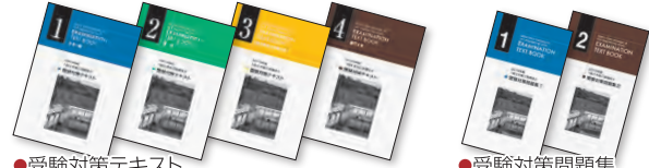
●受験対策テキスト