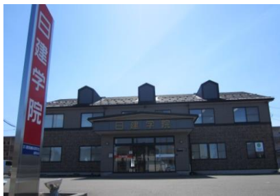
無料駐車場50台完備 コンビニ徒歩3分、イオン車で5分