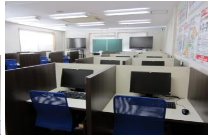
コロナ対策に配慮したブース状の座席