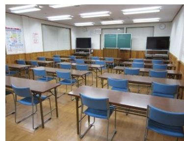
無垢材を使用した健康校舎