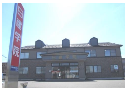
無料駐車場50台完備 コンビニ徒歩3分、イオン車で5分