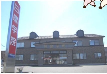
無料駐車場50台完備 コンビニ徒歩3分、イオン車で5分