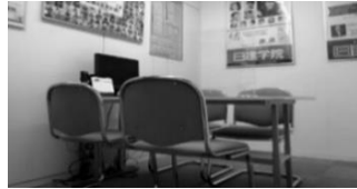
▲面談スペースもあるので就職相談など安心してご利用いただけます。