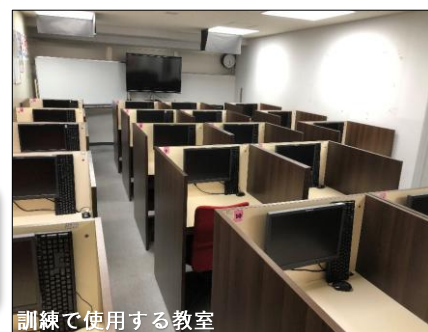
訓練で使用する教室

試験会場のパソコンで解答する試験方式です。従来の解答用紙に記入する統一試験に代わる方式として令和2年に導入されました。ネット試験のメリットとしては、随時受験が可能で、受験後すぐに合否が分かります。